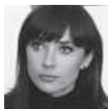
JOANNA SAJKO - STAŃCZYK

Jest rok 1961, budynek w centrum miasta. W pokoju siedzi mężczyzna w zaawansowanym wieku. Jest przywiązany do fotela przewodem elektrycznym. W sąsiednim pokoju przy panelu sterowniczym siedzi „nauczyciel”, ochotnik biorący udział w płatnym eksperymencie, dotyczącym wpływu kar na proces uczenia się. „Nauczyciel” jest instruowany przez psychologa kiedy porazić prądem badanego. Przed rozpoczęciem badania dostaje dokładną instrukcję oraz informację, że bodźce elektryczne nie stwarzają żadnego zagrożenia dla zdrowia i życia „uczni”. Przywiązany do fotela „uczeń” ma natomiast za zadanie nauczyć się na pamięć słów z listy, a gdy popełni błąd, ponieść karę w postaci porażenia odpowiednią dawką prądu. W miarę kontynuacji eksperymentu psycholog zaleca coraz silniejsze dawki prądu. W końcu wskazówka przesuwa się na poziom 330V z napisem: „niebezpieczeństwo, ciężki wstrząs”. Starszy mężczyzna już od